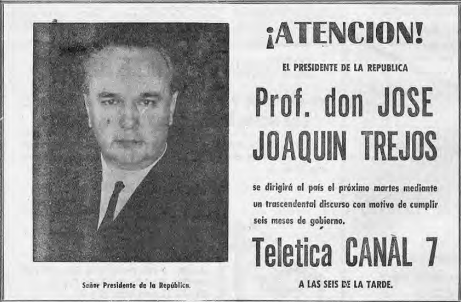
Señor Presidente de la República.