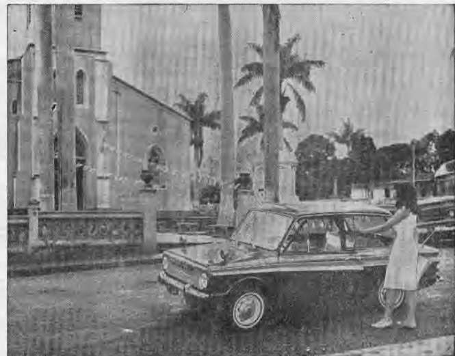
Una bella y distinguida turista frente a la Iglesia Parroquial de Atenas, meta del próximo evento automovilístico que llevará a cabo la "A. C. E. A." El Rally de Precisión San José Atenas — San José mañana domingo 6 de noviembre de 1966.

Y eso es todo por hoy. Buena suerte para nuestros amables lectores.